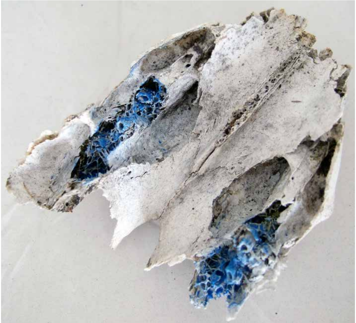
ESCULTURA IV - huesos y pigmento azul, 2011