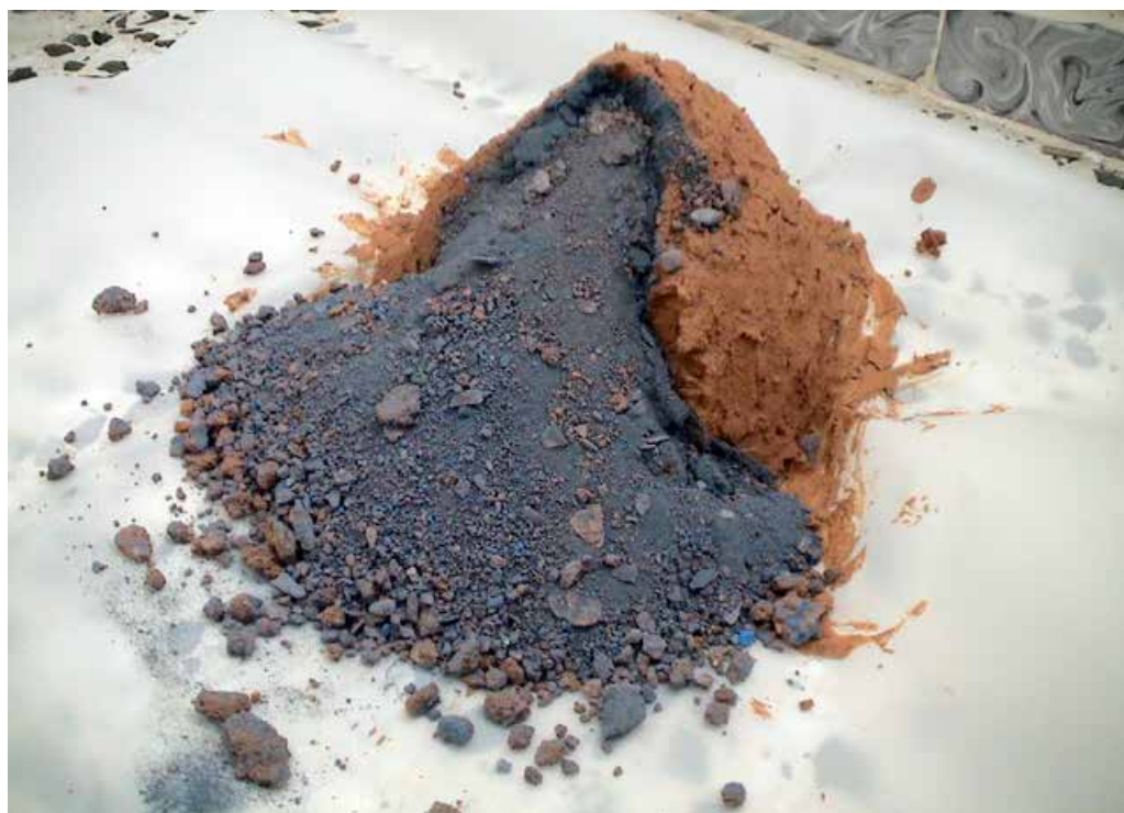
ESCULTURA III - Montículo I , 2011