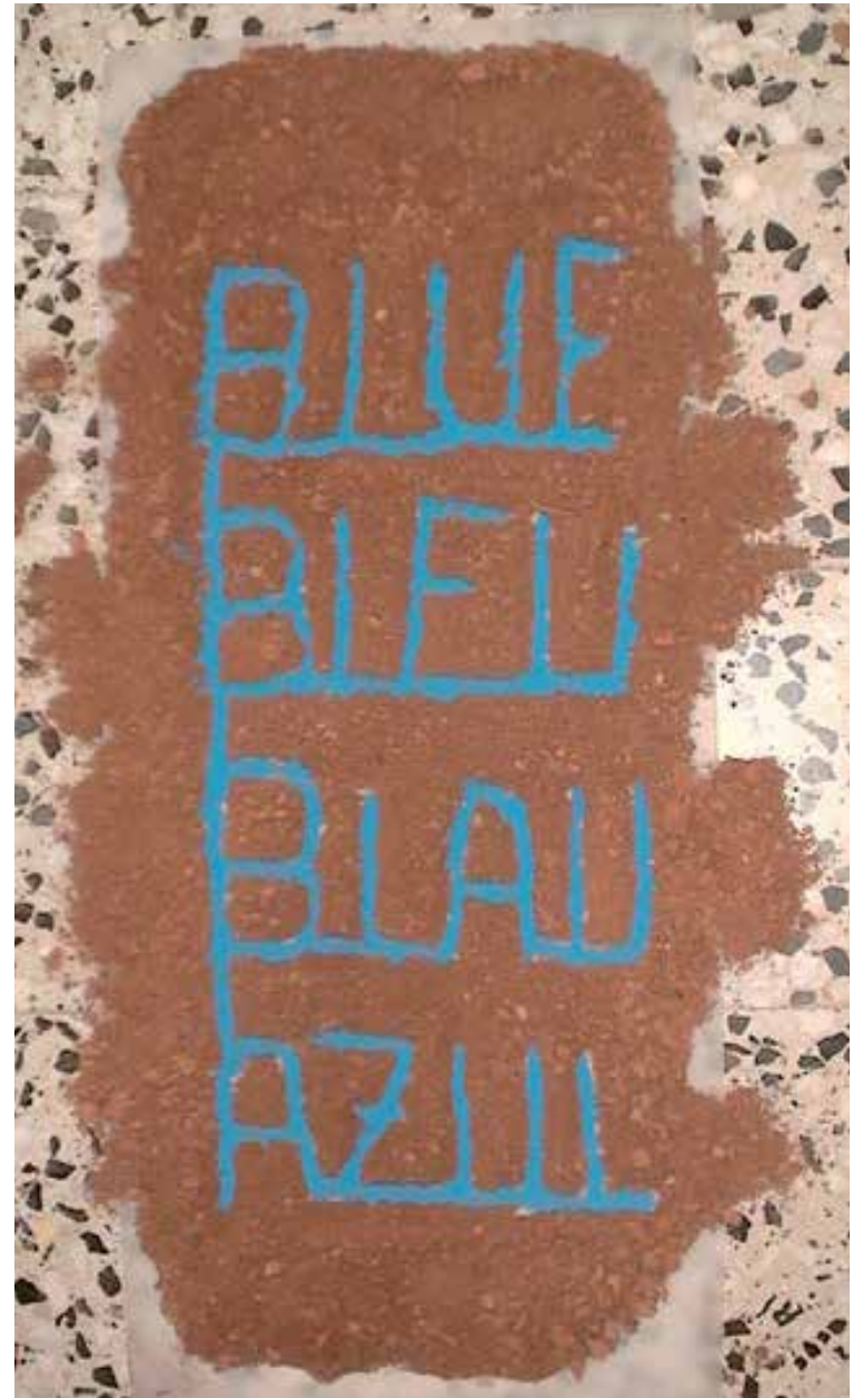
proceso de elaboración de Pinturas de ventana , 2011