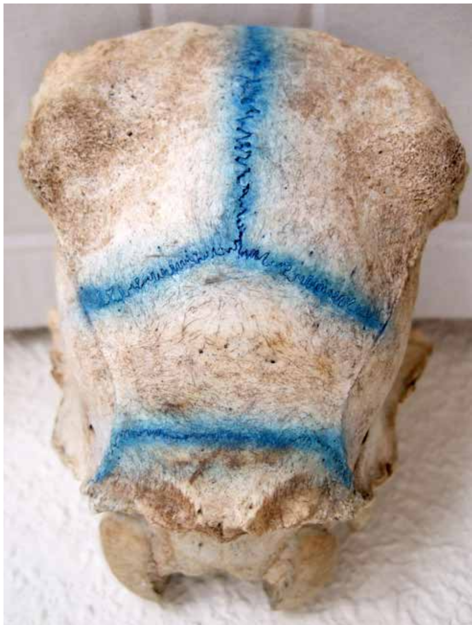
ESCULTURA IV - huesos y pigmento azul, 2011