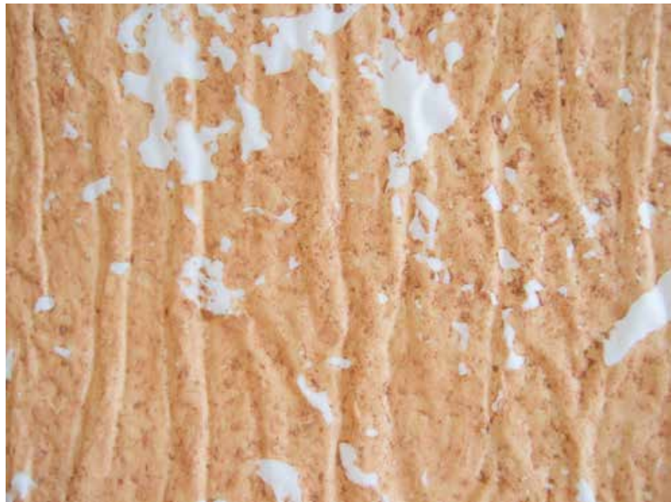
detalles de PINTURAS II tierra roja y agua sobre papel vegetal, 2011