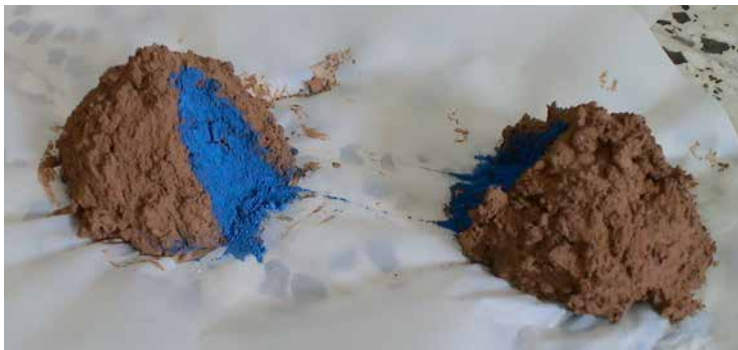
ESCULTURA III - Montículo II, 2011