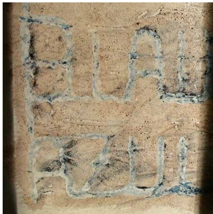
proceso de elaboración de Pinturas de ventana , 2011