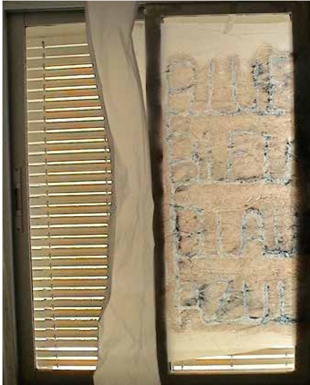
Pintura de ventana, 2011