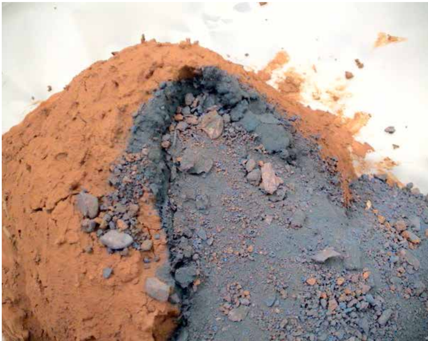
ESCULTURA III - Montículo I tierra roja, pigmento azul y agua, 2011