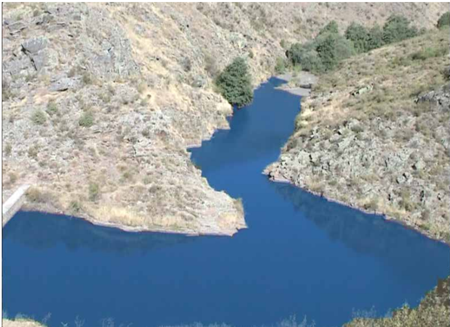
fotograma del vídeo el pantano , 2011