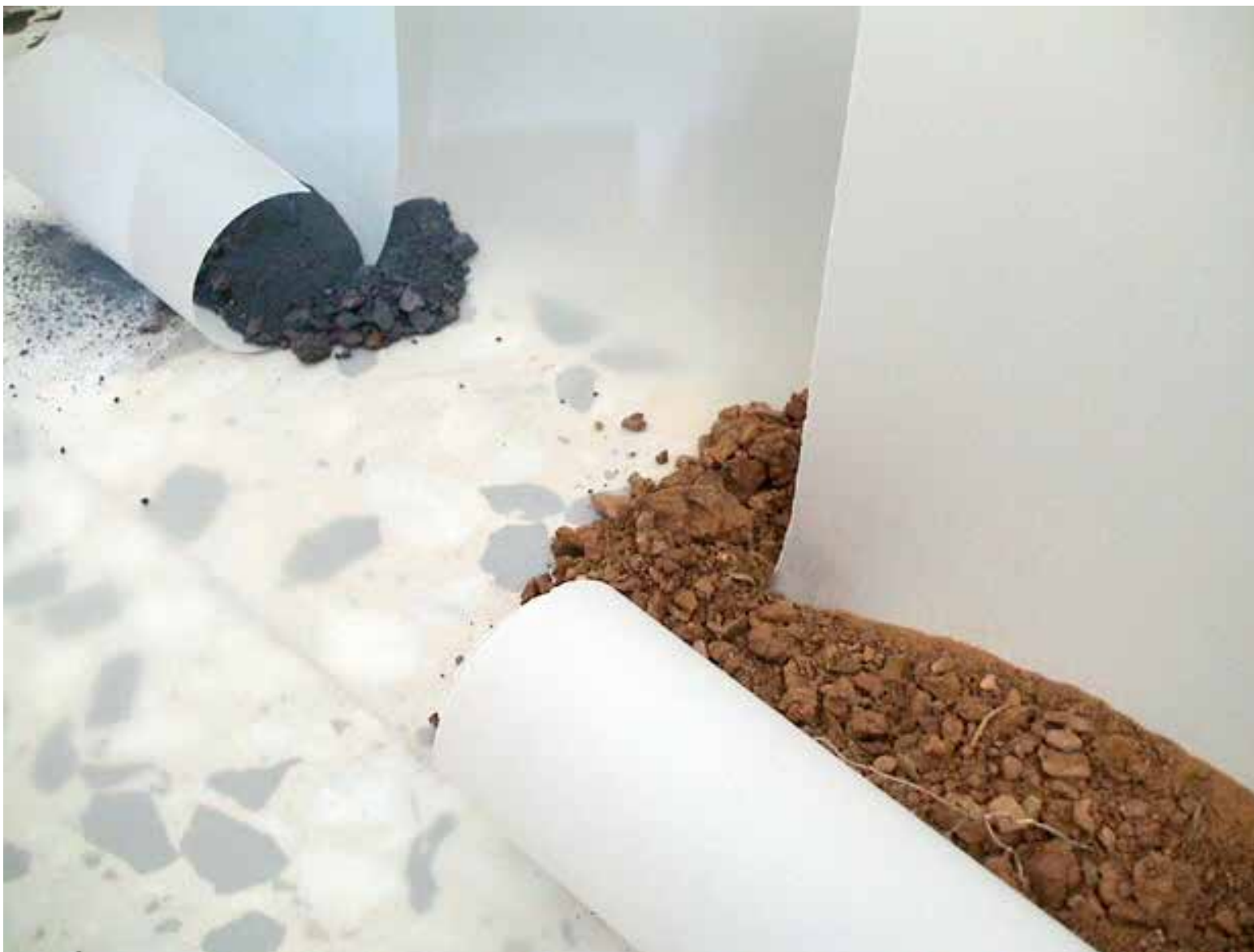
detalle de ESCULTURA II - tierra roja, pigmento azul y papel vegetal, 2011