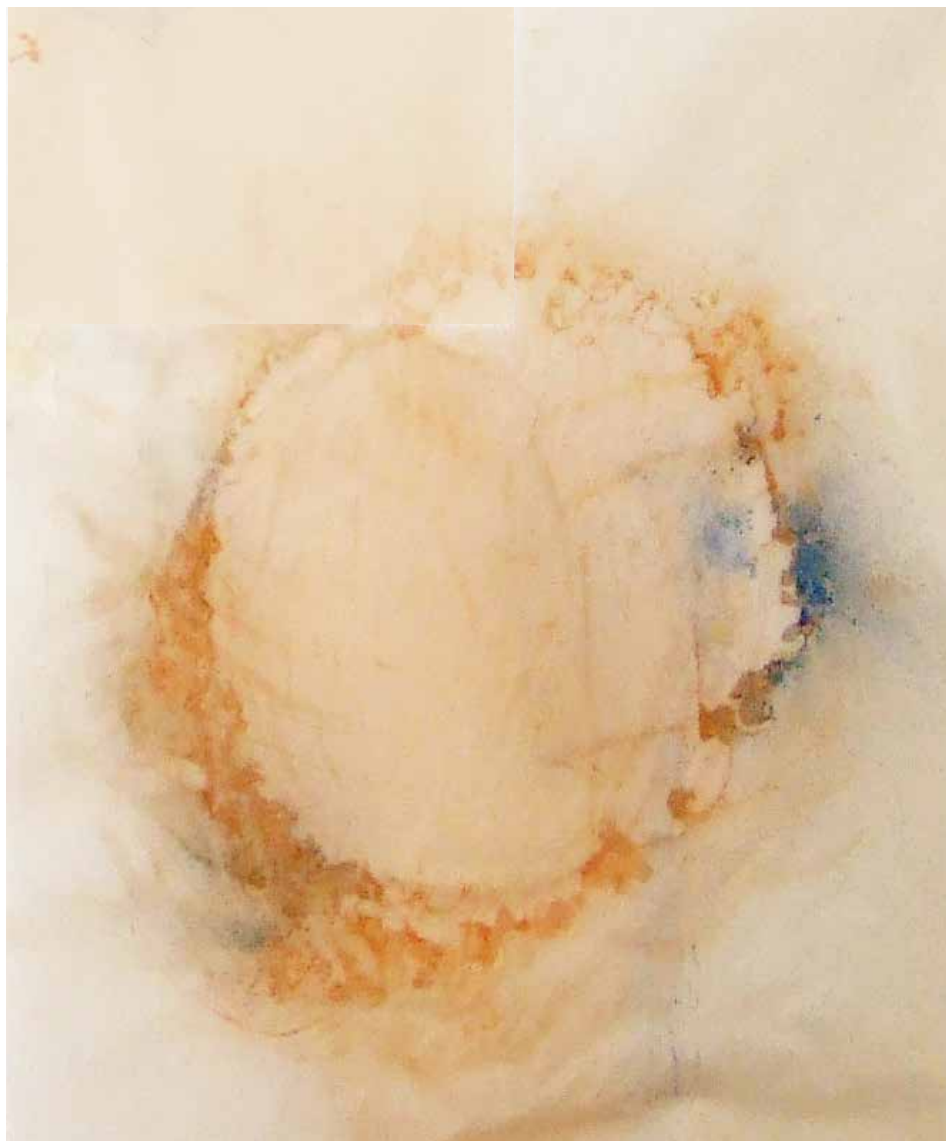
PINTURAS II tierra roja, pigmento azul y agua sobre papel vegetal, 2011