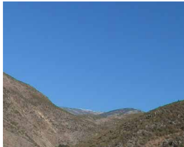
fotogramas del vídeo blue bleu blau , 2011