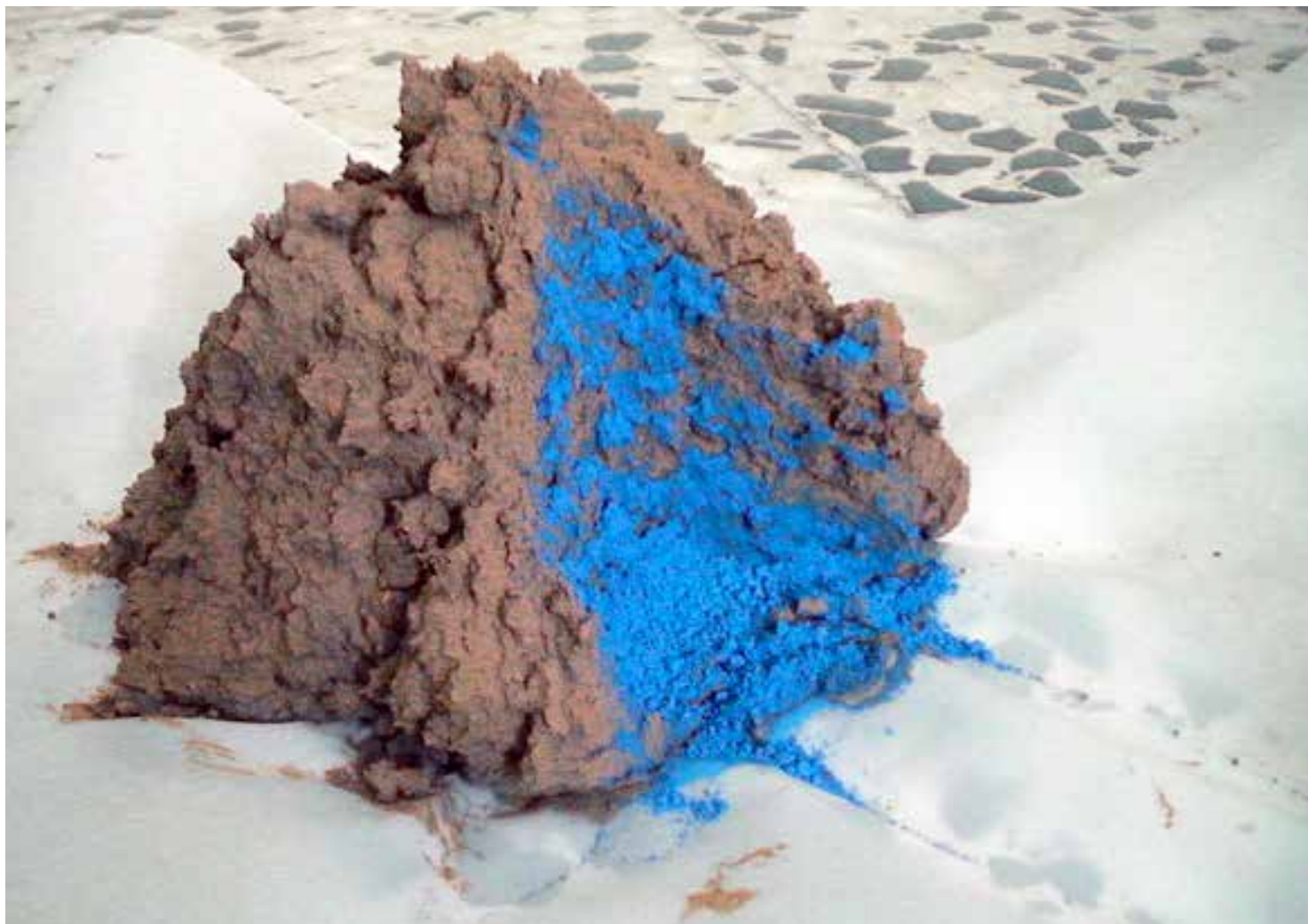
ESCULTURA III - Montículo II tierra roja, pigmento azul y agua, 2011