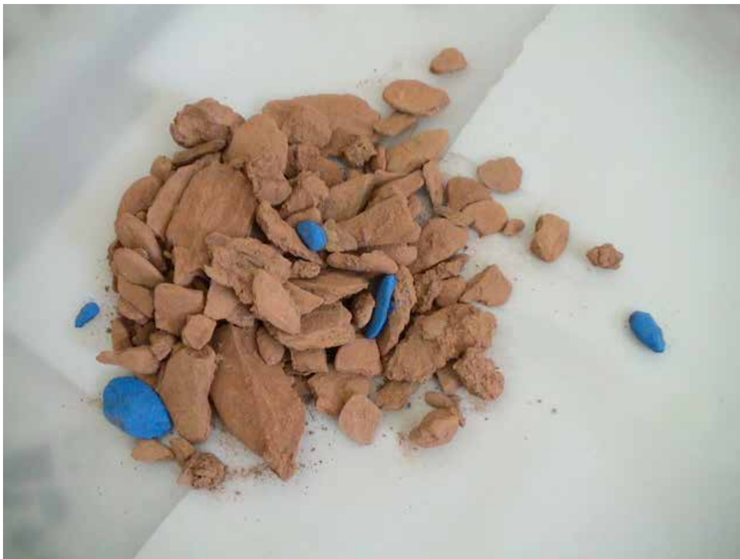
ESCULTURA III - Montículo III piedras y pigmento azul, 2011