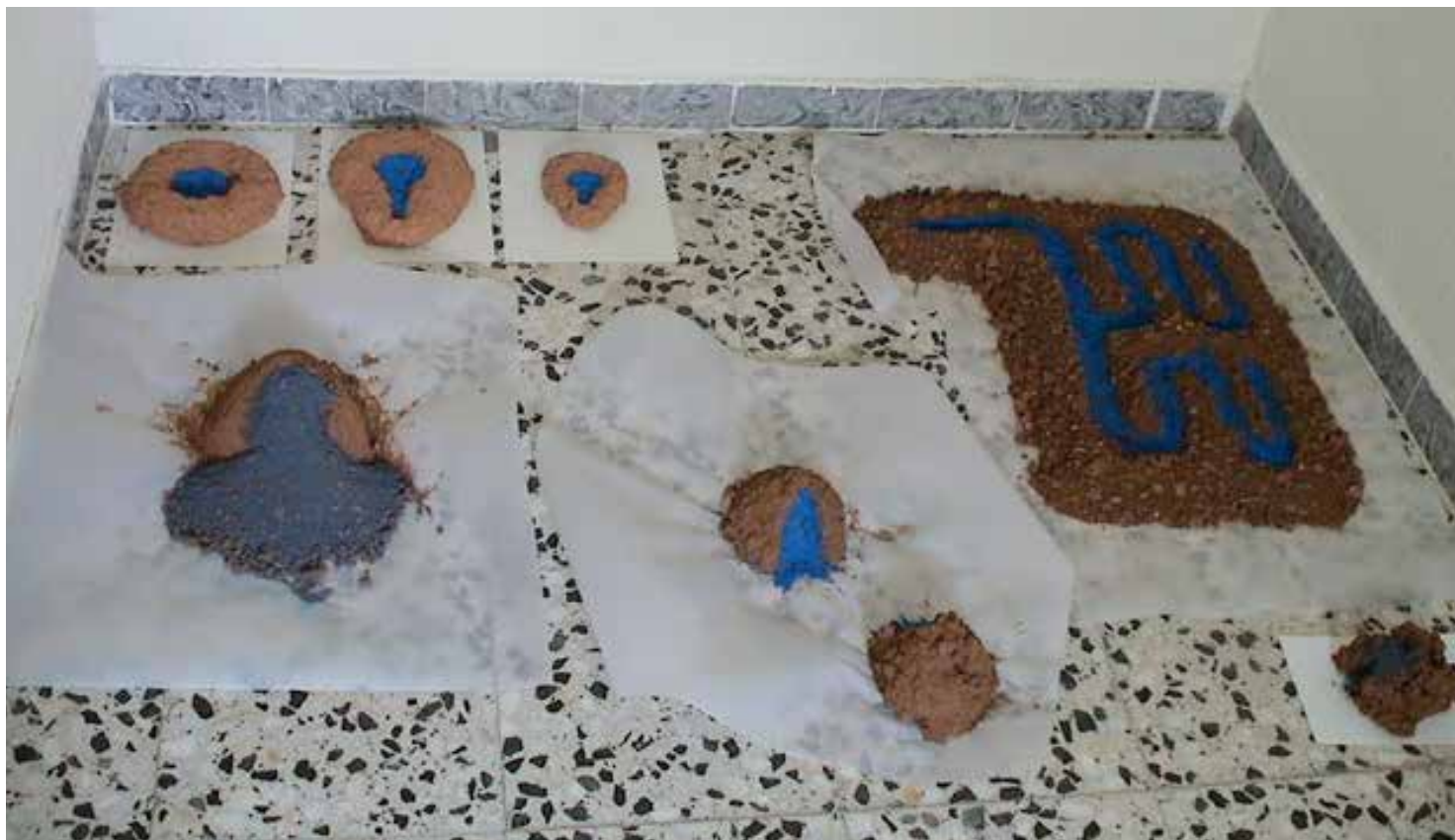
Vista del taller con algunas esculturas en preparación