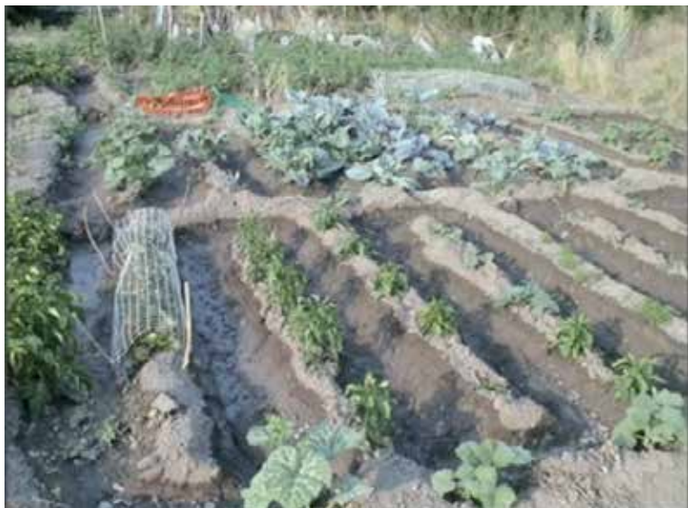
fotograma del vídeo Semanario de mi huerto , 2014

En el pueblo todavía se conserva una tradición ancestral de los huertos. Existe una zona amplia dónde todos tienen su trozo de tierra en vez de huertos individuales al lado de cada casa. Y otra de las singularidades del pueblo es la autogestión del agua comunitaria para el riego de los huertos.