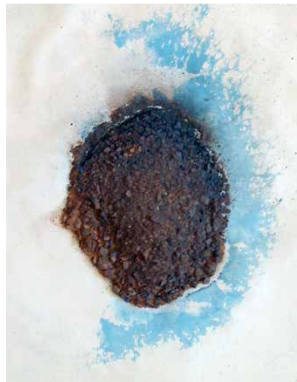
detalle de ESCULTURA I, tabla de tierra roja, pigmento azul y agua sobre hojas de papel de formato A5, 2011