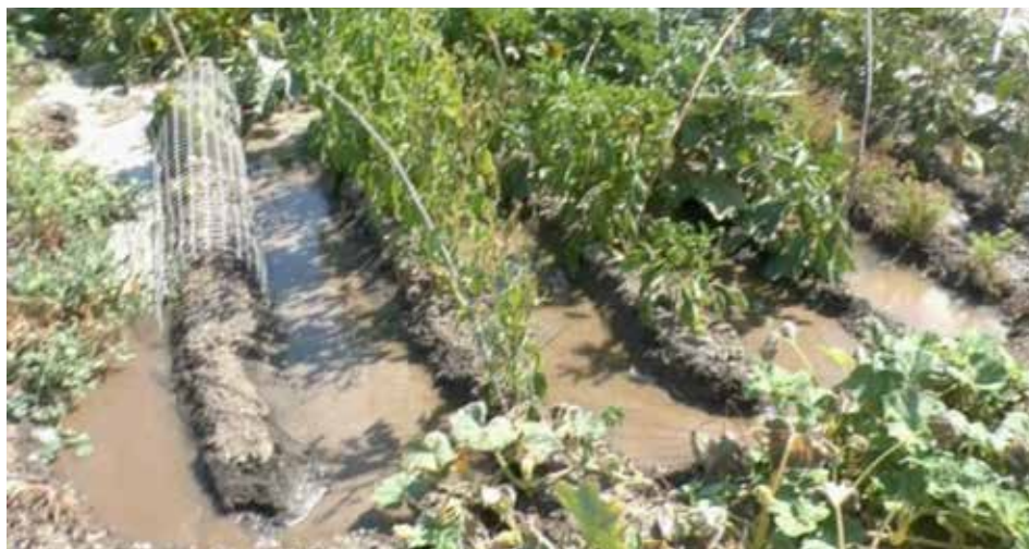
fotograma del vídeo Semanario de mi huerto , 2014

En los huertos se ha creado con tierra un sistema de surcos en forma de serpiente continua por donde se dirige el agua una vez por semana empapando la tierra profundamente. Dicho sistema de surcos se remonta a una tradición árabe de cientos de años y se ha conservado en el pueblo hasta hoy.