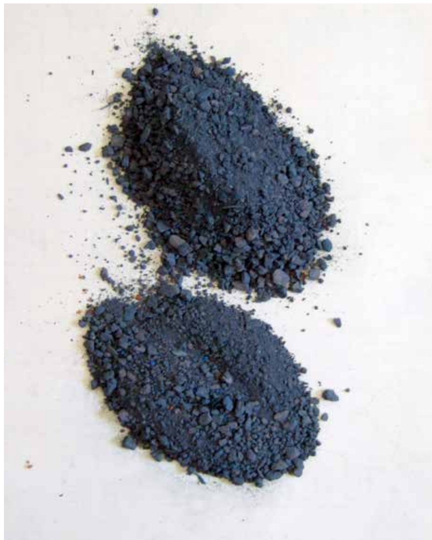
detalle de ESCULTURA I, tabla de tierra roja, pigmento azul y agua sobre hojas de papel de formato A5, 2011