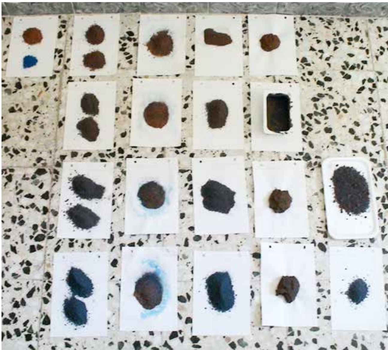
ESCULTURA I, tabla de tierra roja, pigmento azul y agua sobre hojas de papel de formato A5, 2011