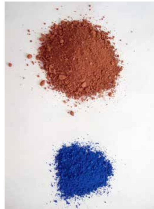
detalla de ESCULTURA I, 2011

Las últimas dos hojas del esquema muestran una posible continuación de la tabla usando diferentes cualidades de la tierra roja - por ejemplo más a menos pedregoso - mezclándola con pigmento azul.