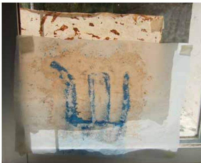
Pintura de ventana tierra roja, pigmento azul y agua sobre papel vegetal, 2011