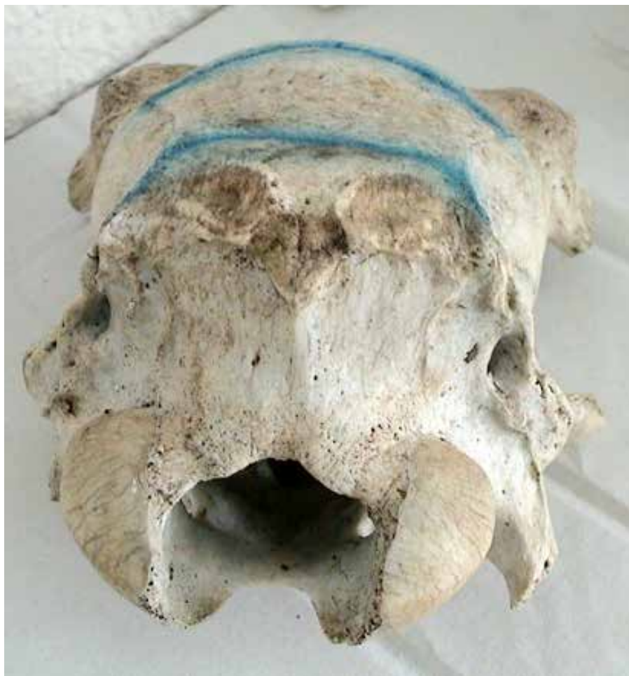
detalles de ESCULTURA IV - huesos y pigmento azul, 2011